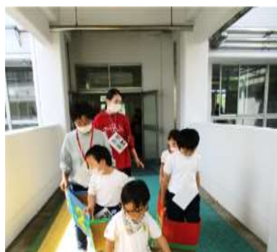
2年「電車に乗って校内案内」