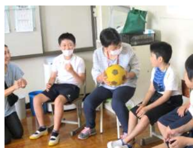
6年「ボール送りリレー」